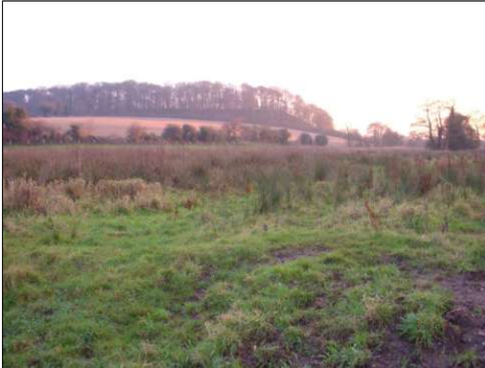
England har en lang tradition for at have fokus på natur-, kultur- og vildtpleje.

Hovedindtryk af forskellene mellem landbrugets rolle i England og Danmark: