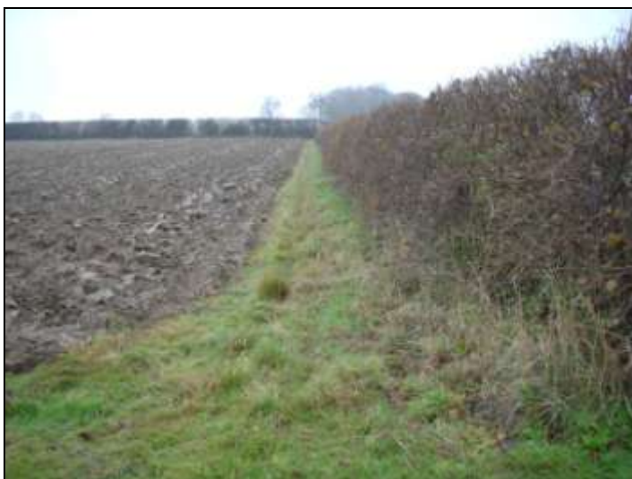
Der gives bl.a. tilskud til pleje af de traditionelle engelske hække.