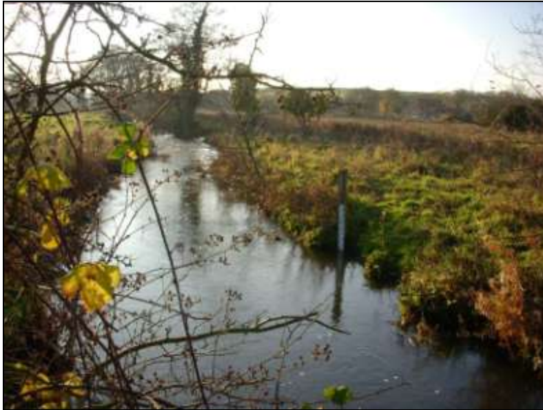
Naturgenopretning ved River Glaven.

Norfolk Wildlife Trust er en organisation, der støttes af mange lokale folk. Det er en organisation, der sikrer koordinat og samarbejde omkring igangsættelse af naturprojekter. Udgangspunktet er, at man har ansat fagfolk, der arbejder på at finde faglige holdbare løsninger med udgangspunkt i en forståelse for samspil mellem natur, miljø og de lokale borgeres interesser.