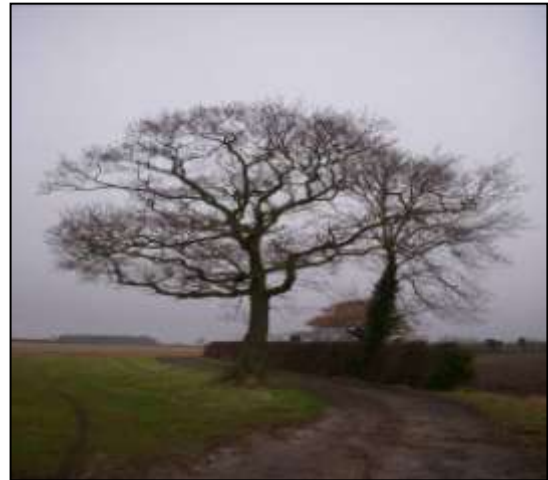
Poul Hovesen har bl.a. etableret randzoner og får tilskud til at bibeholde solitære træer under Entry level.

Der er givet støtte til en del af tiltagene via entry level, - men visse driftsændringer er implementeret qua miljørådgivningen (altså uden støtte). Det bemærkes, at enkeltbetaling + entry level tilsammen giver samme støtteniveau, som vi i Danmark får via enkeltbetalingen. Poul når hovedsageligt de 30 point per ha, der kræves for at få entry level ved beskæring af hække, ved etablering af randzoner og ved at bevare enkeltstående træer (man belønnes altså også for den indsats, man allerede har lavet).