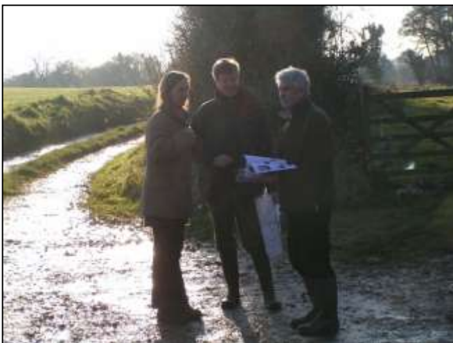
Problemer med oversvømmelse ved River Glaven.

Endelig har man ved at fjerne opstemninger sikret, at der ved kraftig nedbør ikke sker oversvømmelser i den lokale landsby, men at vandet i stedet oversvømmer engområderne.